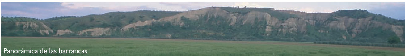
Panorámica de las barrancas

Su fauna más llamativa está representada por numerosas aves rupícolas, algunas de ellas amenazadas, como el águila-azor perdicera, el halcón peregrino o el búho real, que encuentran un hábitat idóneo para la nidificación en las paredes verticales de los cortados.