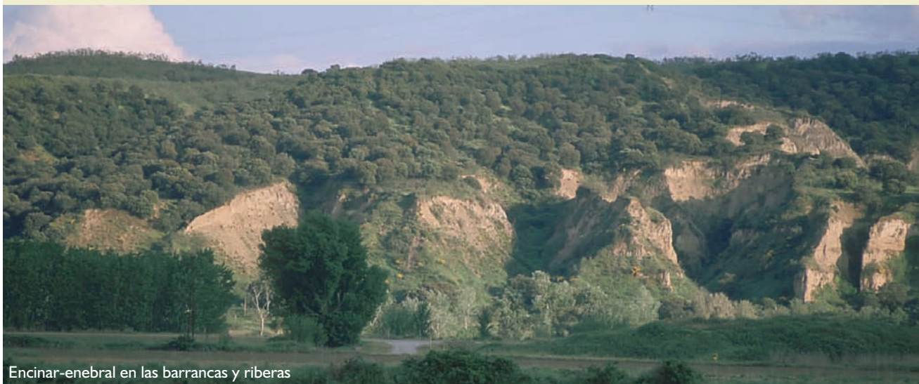
Encinar-enebral en las barrancas y riberas

Época aconsejable de visita y otras recomendaciones: cualquier época del año. Existe una senda ecológica con miradores.