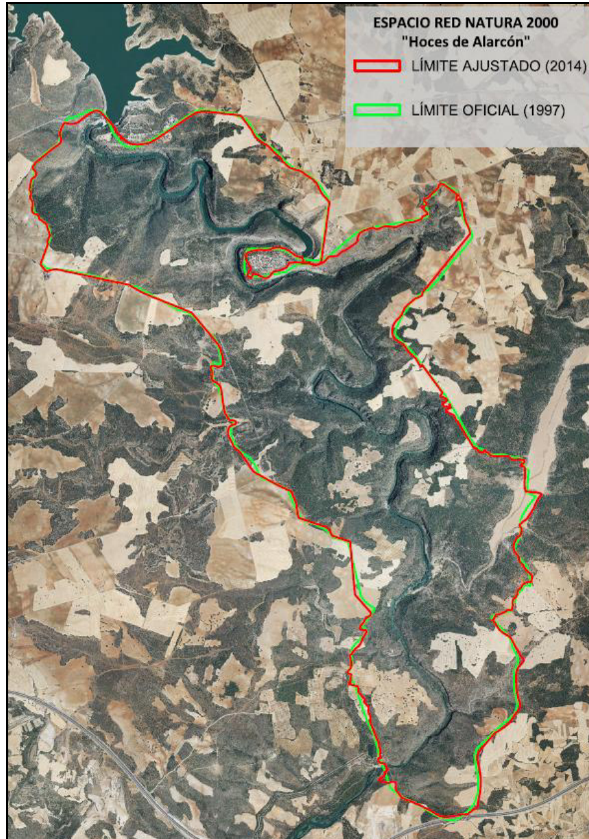
Fig. 1. Comparación entre el límite oficial (1997) y el límite ajustado (2014) para el espacio Natura 2000.