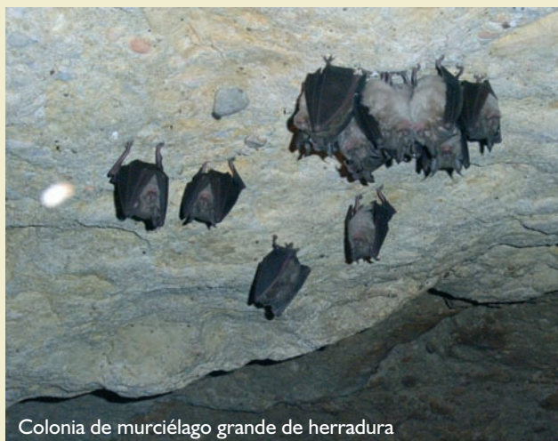
Colonia de murciélago grande de herradura