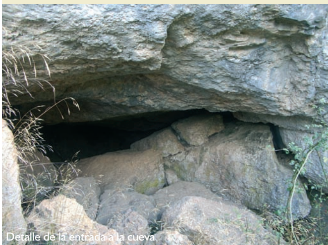
Detalle de la entrada a la cueva

Época aconsejable de visita y otras recomendaciones: el acceso a la cueva no está permitido al suponer graves molestias para los murciélagos. La totalidad del LIC está sobre terrenos de propiedad particular.