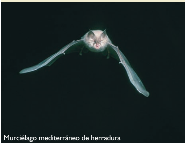
Murciélago mediterráneo de herradura

Época aconsejable de visita y otras recomendaciones: todo el año. La visita al interior de los túneles, sobre todo en el periodo de hibernación, no está permitida, dado que puede perturbar a la población de murciélagos.