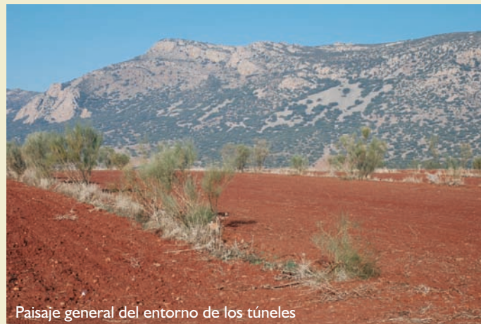
Paisaje general del entorno de los túneles