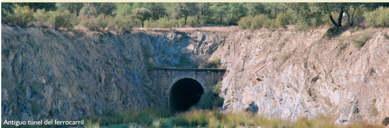
Antiguo túnel del ferrocarril

Época aconsejable de visita y otras recomendaciones: todo el año. La visita al túnel no está permitida, existiendo un vallado en las entradas. El uso recreativo como vía verde de la antigua línea ferroviaria está permitido.