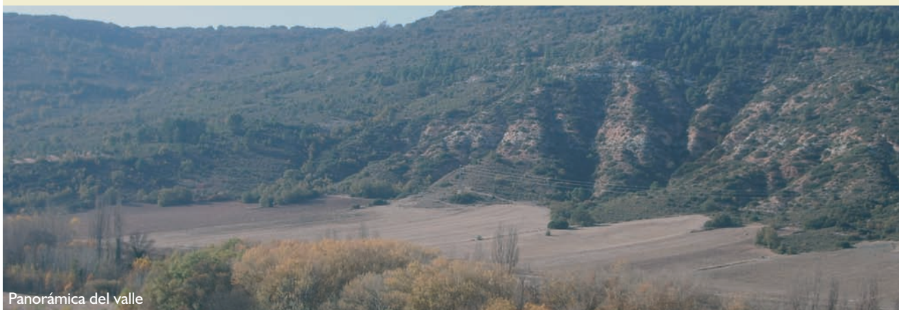
Panorámica del valle

Época aconsejable de visita y otras recomendaciones: otoño y primavera. Es recomendable la visita a Brihuega y al cercano "Balcón del Tajuña", en Valfermoso.