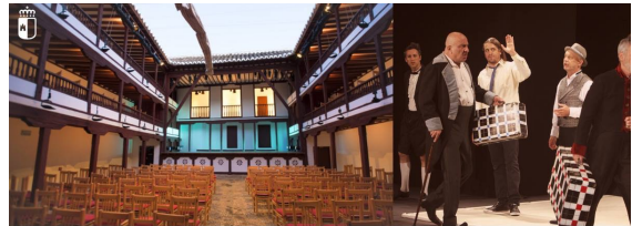
El Gobierno de Castilla-La Mancha felicita al Festival de Teatro de Almagro por la organización de una edición accesible e inclusiva